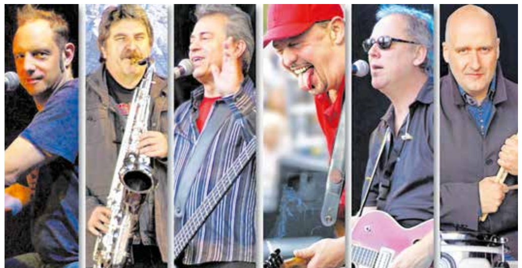
Zum Fest am 25. August steht unter anderem die Kultband »Spider Murphy Gang« auf der Bühne.

12 Uhr | Marx-Monument NightFever Band 12.30 – 13 Uhr | Stadthallenpark Ulf Kinderprogramm 13 – 13.30 Uhr | Marx-Monument Night Fever Band 13.30 – 14:15 | Marx-Monument KultHitShow 14.30 – 15 Uhr | Stadthallenpark Ulf Kinderprogramm Ab 14.30 – 17 Uhr | Marx-Monument Reserve-Zeit DGB 16.15 – 16.50 Uhr | Stadthallenpark