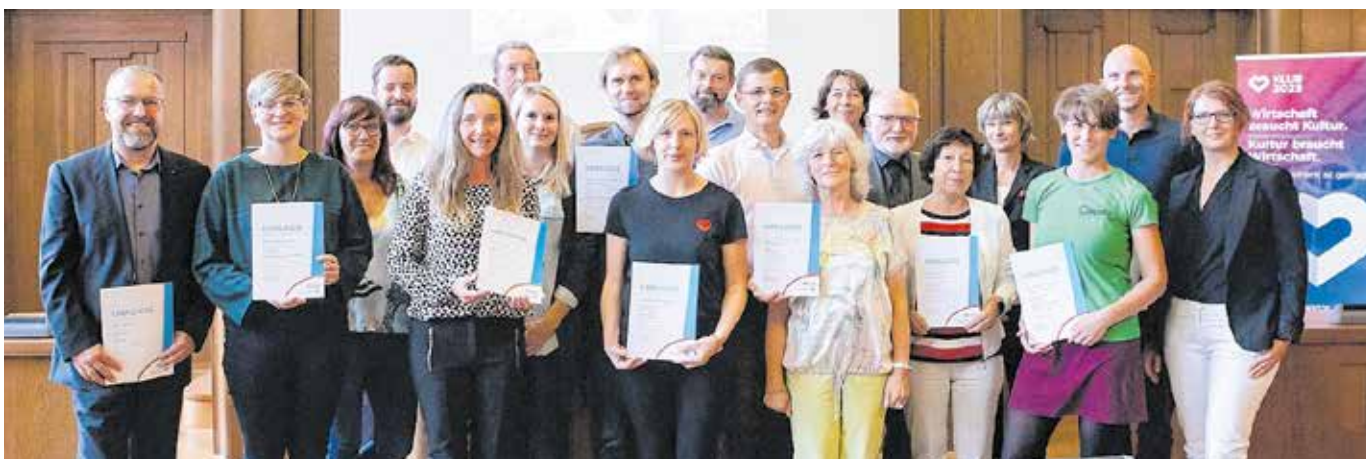
Zehn Lieblingsplätze für Chemnitz2025 wurden ausgewählt: Hier die Gewinner des Wettbewerbs.