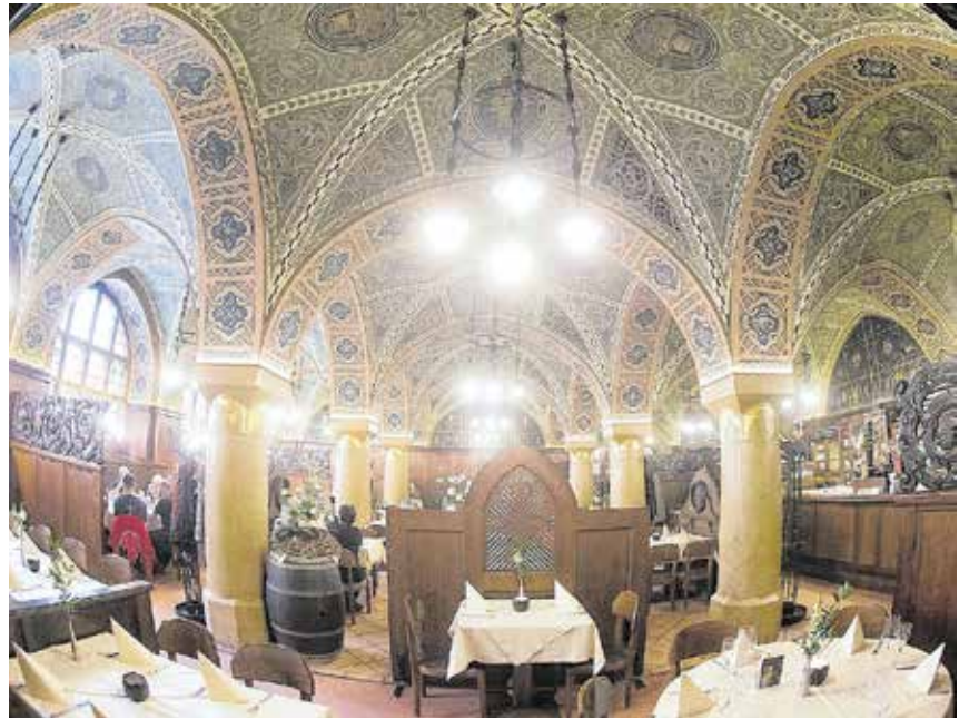
Aktuell ist hier eine Baustelle: Bei der Ratskellersanierung gilt es die historische Gebäudesubstanz zu schützen. Schließlich sind die Gasträume weitgehend in originaler Wand- und Deckenfassung erhalten. Vor allem die historischen Gewölbedecken sind bemerkenswert.