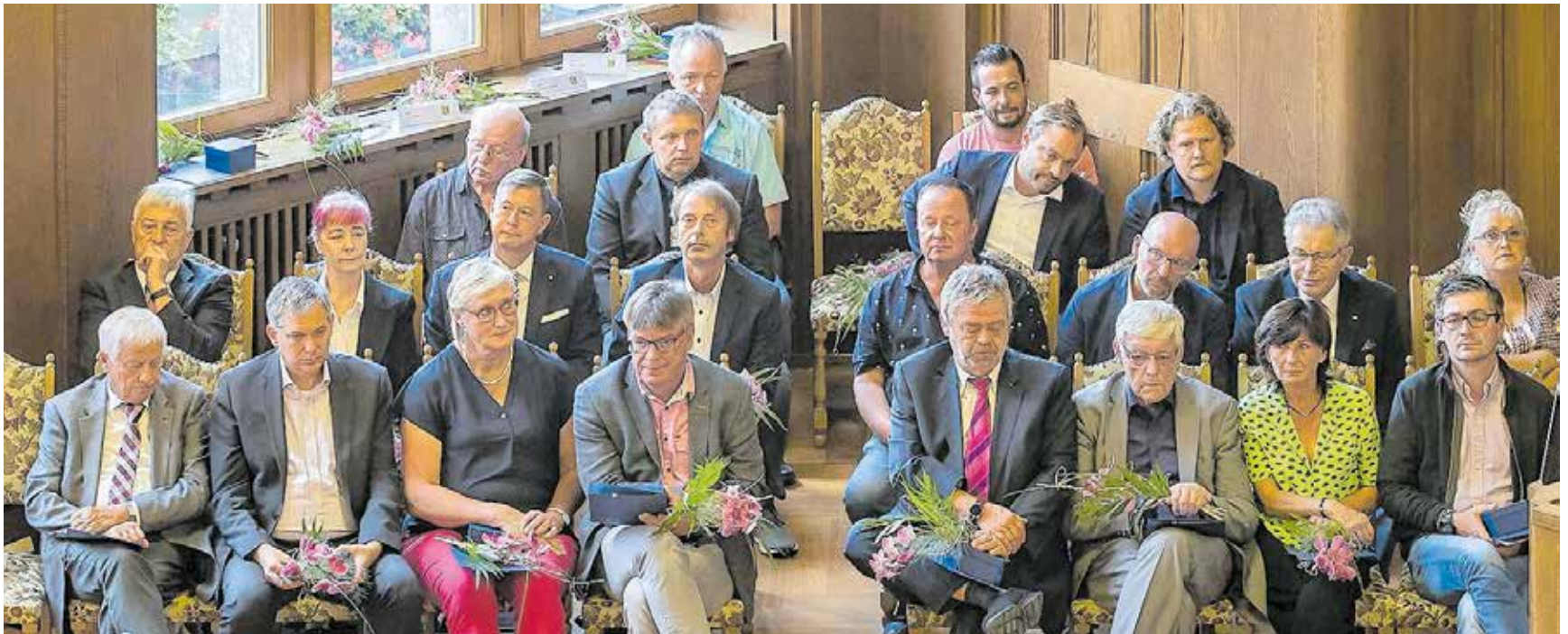
Ausgeschiedene Stadträtinnen und Stadträte (hier im Bild) sind am Mittwoch feierlich mit dem Eintrag in das Goldene Buch der Stadt Chemnitz verabschiedet worden.