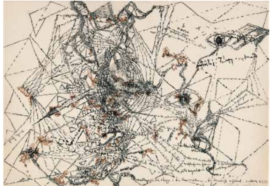
Die Kunstsammlungen Chemnitz zeigen Kunst von Bernard Schultze, darunter das Bild »Anakreon-Zitat«. Es entstand 1988. Kunstpalast, Düsseldorf, Stiftung Sammlung Kemp, Foto: Kunstpalast - LVR-ZMB - Annette Hiller/ARTOTHEK © VG Bild-Kunst, Bonn 2019