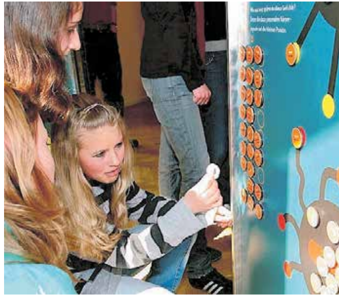
Blick in die Ausstellung »Echt fair!«.

Die Informationsstationen der Ausstellung »Echt fair!« richten sich besonders an Mädchen und Jungen aus dem 5. bis 8. Schuljahr und