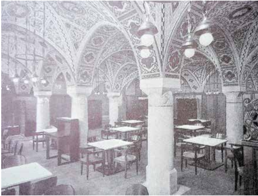
Das Neue Rathaus wurde nach Plänen von Stadtbaurat Richard Möbius erbaut und im September 1911 eingeweiht. Auf dem historischen Foto ist das prachtvolle Interieur des Ratskellers (Neumarktsteite) zu sehen.