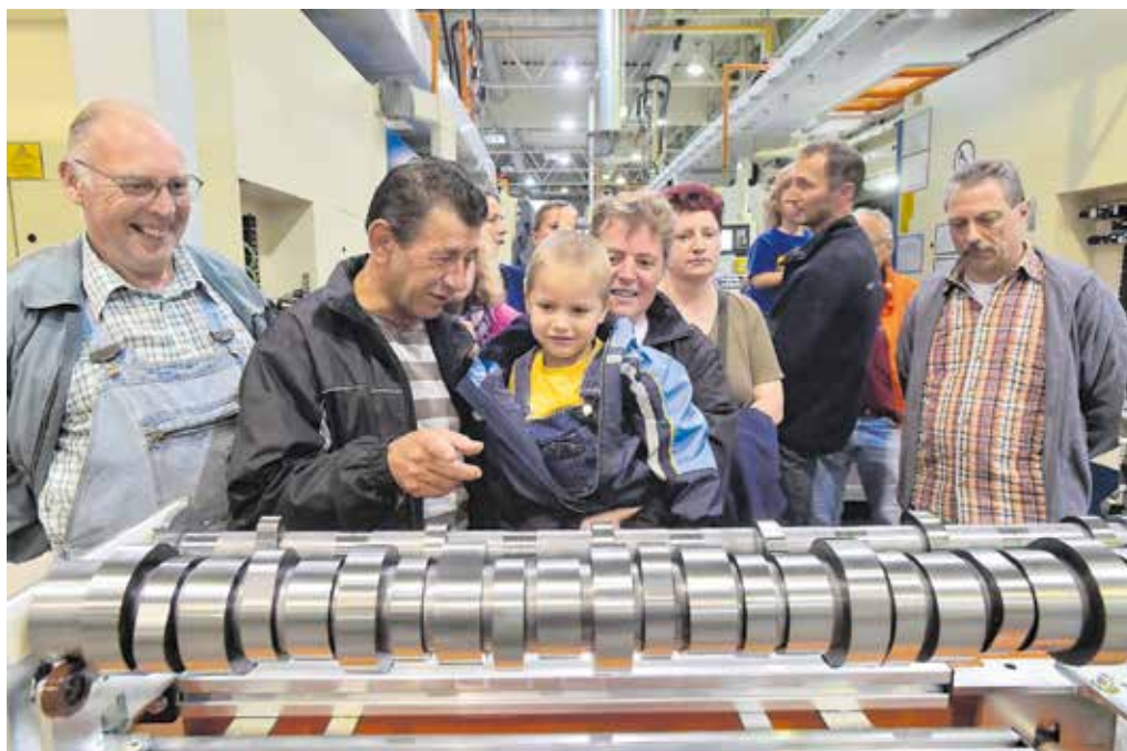
Besichtigung bei ThyssenKrupp Presta Chemnitz während einer früheren "Spätschicht".

Wer kennt Wendt & Kühn – die 1915 gegründete Traditionsmanufaktur nicht? Sie steht für deutsche Handarbeit in ihrer schönsten Form. Figuren und Spieldosen begeistern