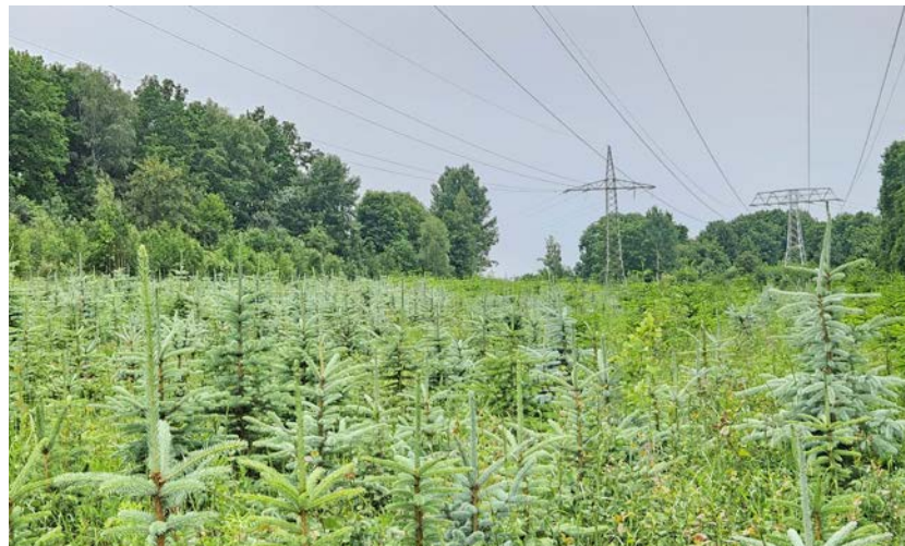
Seit dem Sommer sind die Blaufichten und Nordmantantannen noch ein Stück gewachsen und können nun geschlagen werden.

Die Bäume sind ohne Pestizideinsatz und ohne Düngung gewachsen. Jeder Baum kostet 20 Euro, die mit EC-Karte oder bar gezahlt werden können. Wer möchte, kann seinen Baum im Netz verpackt mit nach Hause nehmen. Die Zufahrt mit dem Auto erfolgt von der Tännichtleite durch die offene Schranke. Ab Stiftsweg und Slevogtstraße wird die Zufahrt ausgeschildert. Die