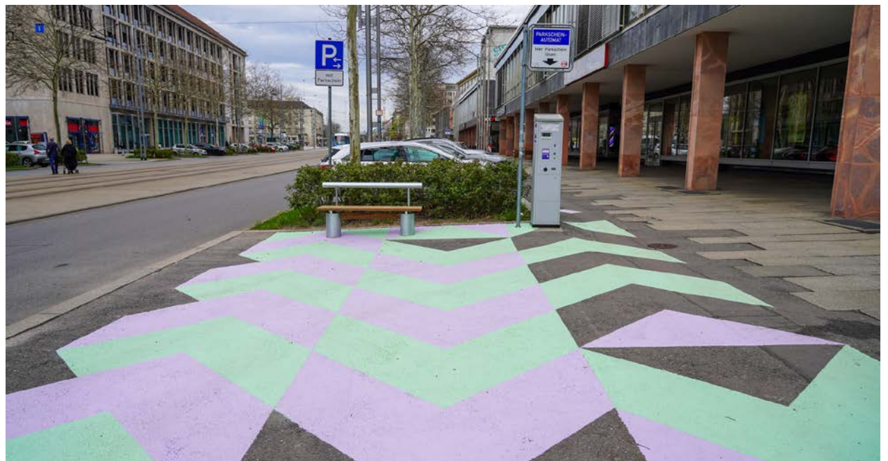
Entlang der Kreativachse sind auch neue Aufenthaltsorte entstanden.

Die Stadt Chemnitz erhielt für das Projekt Kreativachse Chemnitz aus diesem Programm rund 2,6 Millionen Euro Fördermittel des Bundes. Zusammen mit einem Anteil der Stadt wurden somit circa 3,3 Millionen Euro eingesetzt. Das Projekt Kreativachse Chemnitz war ein Vorhaben zur Belebung innenstadtnaher Straßenzüge mit einem hohen Leerstand an Gewerbeeinheiten im Erdgeschossbereich, zu geringer Kundenfrequenz oder einer mangelnden Aufenthaltsqualität. Der Projektbereich erstreckte sich über den Brühl-Boulevard, die Karl-Liebkecht-Straße, Teile der Georgstraße sowie die Straße der Nationen zwischen Karl-Marx-Monument und Omnibusbahnhof und führte durch die Fußgängertunnel des Hauptbahnhofs weiter in Richtung Sonnenberg. Dort verbindet die Kreativachse das neu entstandene Fernbusterminal