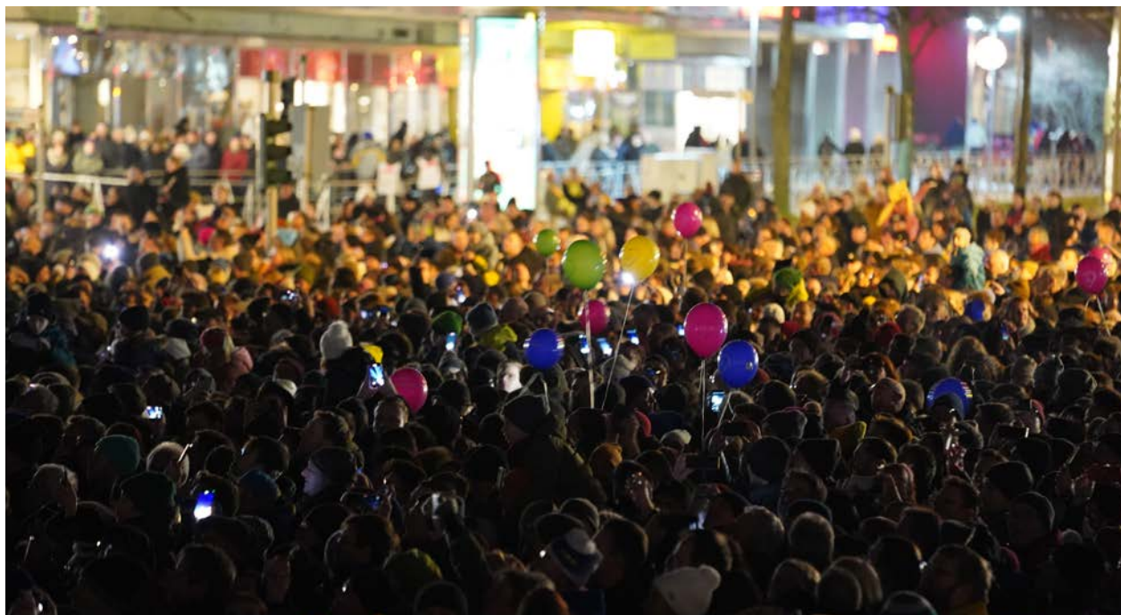
Zum Finale der Kulturhauptstadt wird das Chemnitzer Zentrum wieder zur Tanzfläche.

Das Weihnachtssingen auf dem Theaterplatz hat bereits in den vergangenen Jahren Besucherinnen und Besucher aus Nah und Fern angelockt. Zum Abschluss des Kulturhauptstadtjahres sind alle herzlich eingeladen, gemeinsam mit