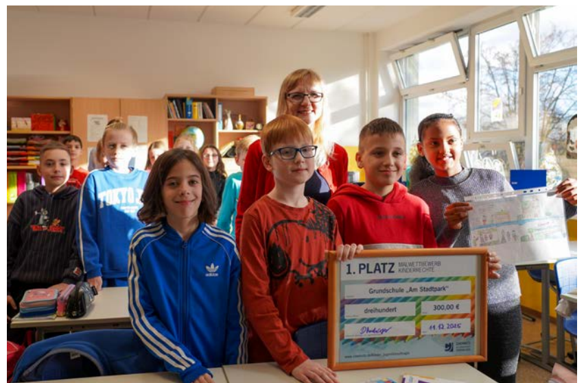
Die Kinder der Grundschule »Am Stadtpark« freuten sich über den ersten Platz beim Malwettbewerb zu Kinderrechten.

www.chemnitz.de/kinder_jugendbeauftragte