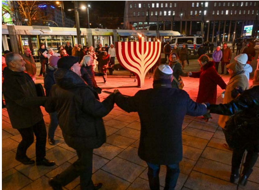
Beim Auftakt des »Jahres der jüdischen Kultur« feierten und tanzten die Menschen vor dem großen Chanukka-Leuchter in der Chemnitzer Innenstadt.

Eröffnet wurde das Themenjahr am 14. Dezember, dem Vorabend des ersten Chanukka-Tages im Staatlichen Museum für Archäologie Chemnitz, wo Landesrabbiner Zsolt Balla und Ministerpräsident Michael Kretschmer das erste Licht eines in Seiffen gefertigten Chanukka-Leuchters entzündeten. Im Jahr 2026 wird zugleich an die Gründung des Sächsischen Israelitischen Gemeindeverbands vor 100 Jahren erinnert. Das Motto Tacheles steht daher