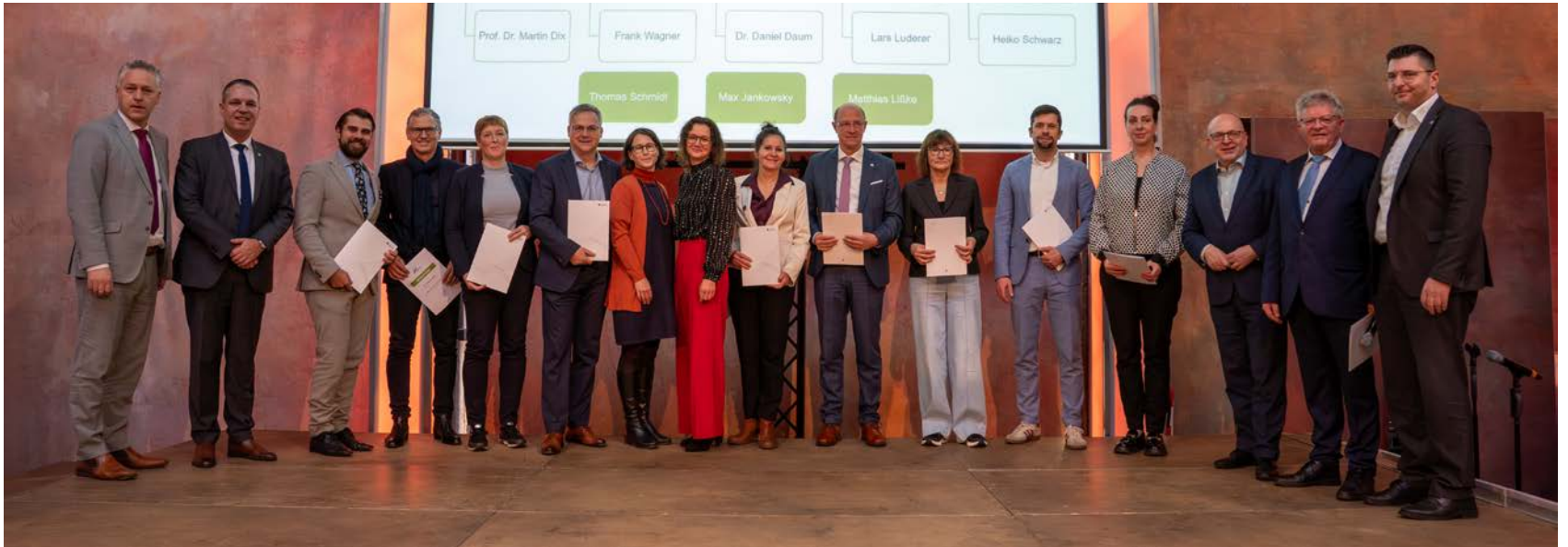
Das Kick-off-Event zum Masterplan fand in Chemnitz statt.