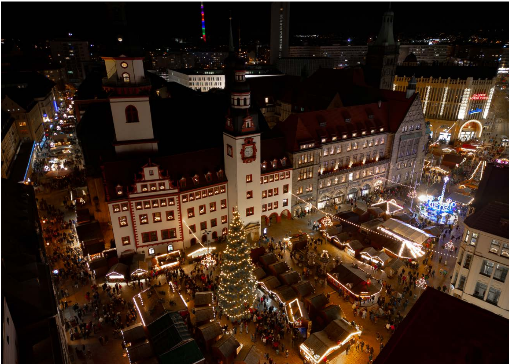
Der Chemnitzer Weihnachtsmarkt aus der Vogelperspektive.