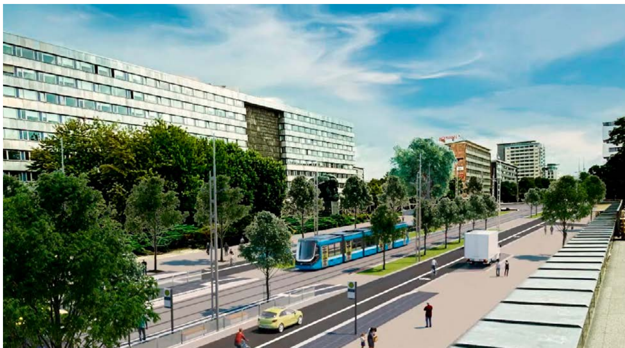
Unter anderem führt der Zentrumsring künftig entlang der Brückenstraße.

»Die Genehmigung des Planfeststellungsverfahrens durch die Landesdirektion Sachsen ist ein Meilenstein für die Fortschreibung des Chemnitzer Modells«, erklärte Sven Schulze, Oberbürgermeister der Stadt Chemnitz. »Damit kann der Ausbau im Chemnitzer Zentrum nun beginnen und dieses Zukunftsprojekt konkret umgesetzt werden. Das Chemnitzer Modell steht