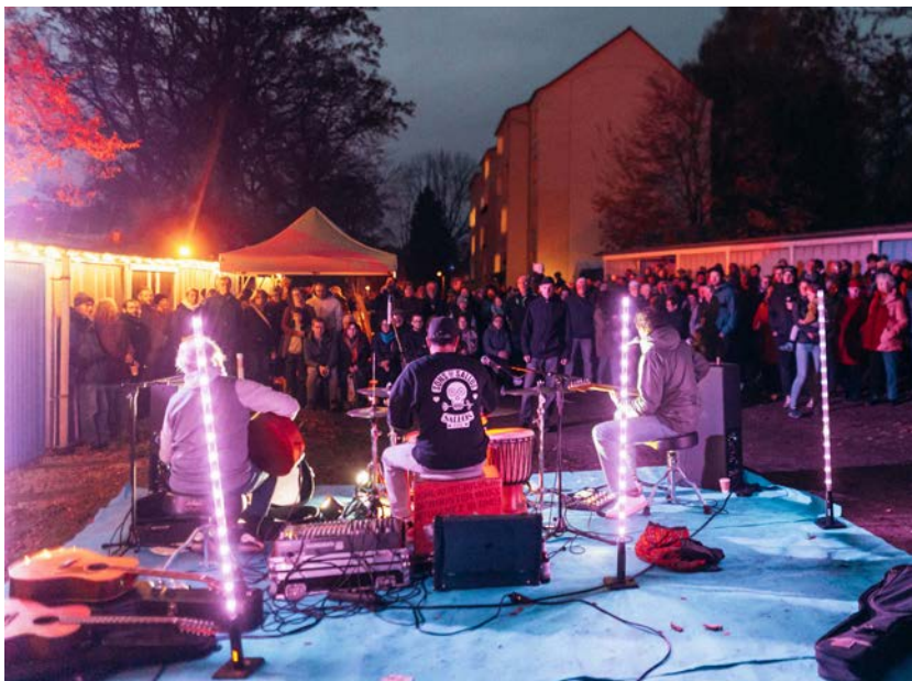
Die akustische Liveband »Asphalttrakteten« spielt beim letzten Garagenkonzert 2025 im Garagenhof Ahornstraße vor zahlreichen Zuhörerinnen und Zuhörern.

Alle Berichte sind zu finden unter: www.chemnitz2025.de/freiwillige