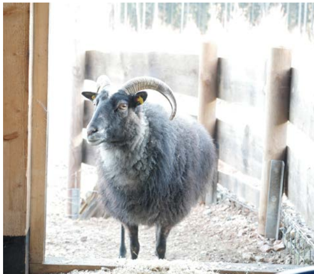
Seltene Neuzugänge im Wildgatter Oberrabenstein: Links ein Guteschaf, eine schwedische Landrasse von der Insel Gotland, rechts die farbenfrohen Schwedischen Blumenhühner.