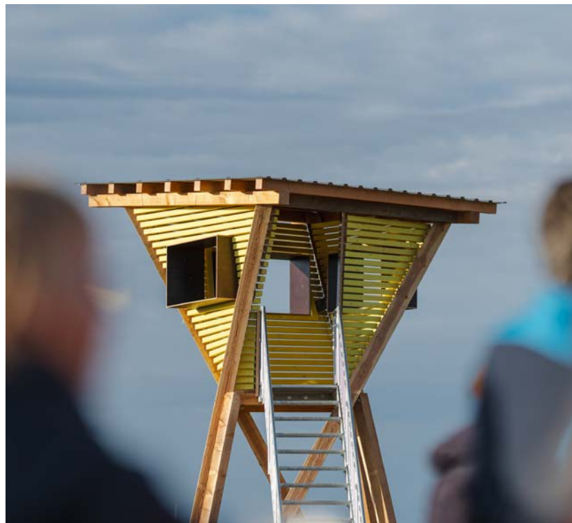
Die Skulptur »Twisted Peek« verbindet konstruktivistische Formensprache mit der Geschichte des Sachsenrings und seiner Hochsitze.

Die Skulptur »Braided Journey« (Deutsch: geflochtene Reise) stellt eine