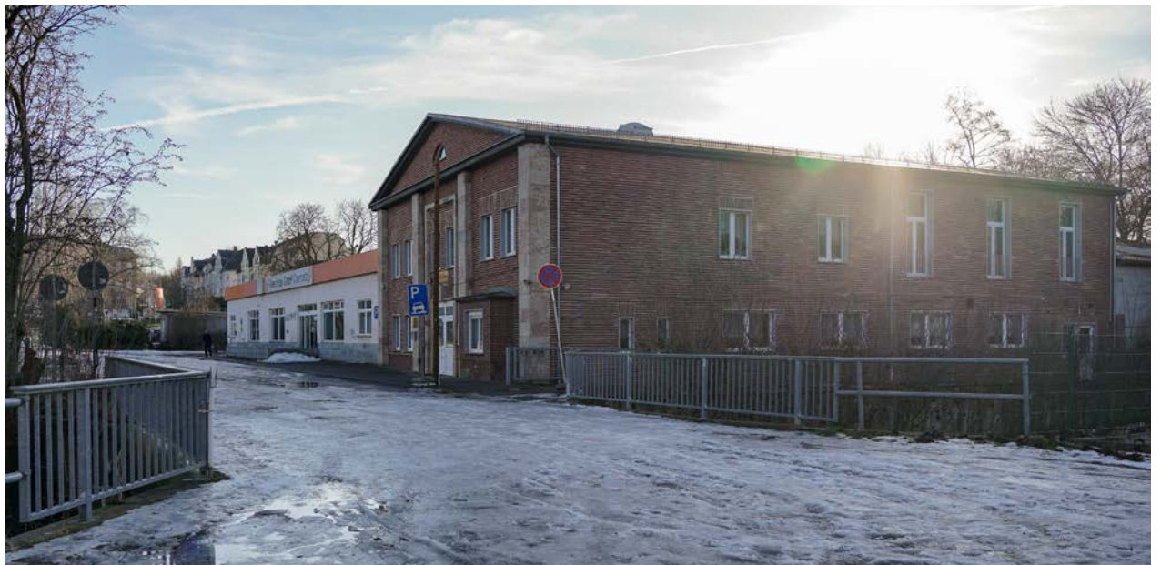
Die Brücke »Am Stadtgut« wird durch eine mit größerer Spannweite ersetzt.

Fußgängerinnen und Fußgänger sowie Radfahrende werden gebeten, über die neue Talbrücke im Park auf Höhe der Kochstraße oder über die Rudolf-Krahl-Straße auszuweichen. Eine entsprechende Umleitung wird eingerichtet.