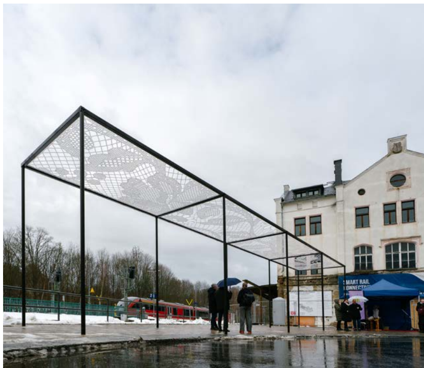
Das Kunstwerk »Braided Journey« der Künstlergruppe Redfort architectural fabrics am Unteren Bahnhof in Annaberg-Buchholz verbindet Kunst, Funktionalität und lokale Handwerkstradition auf besondere Weise.

Barbara Uthmann (1514–1575) war eine begüterte »Fundgrübnerin«, das heißt, sie war Bergwerkseigentümerin in Annaberg, Buchholz, Schneeberg (Kupfer), sowie Ehrenfriedersdorf und Marienberg (Silber). Sie übernahm nach dem frühen Tod ihres Mannes die Lei-