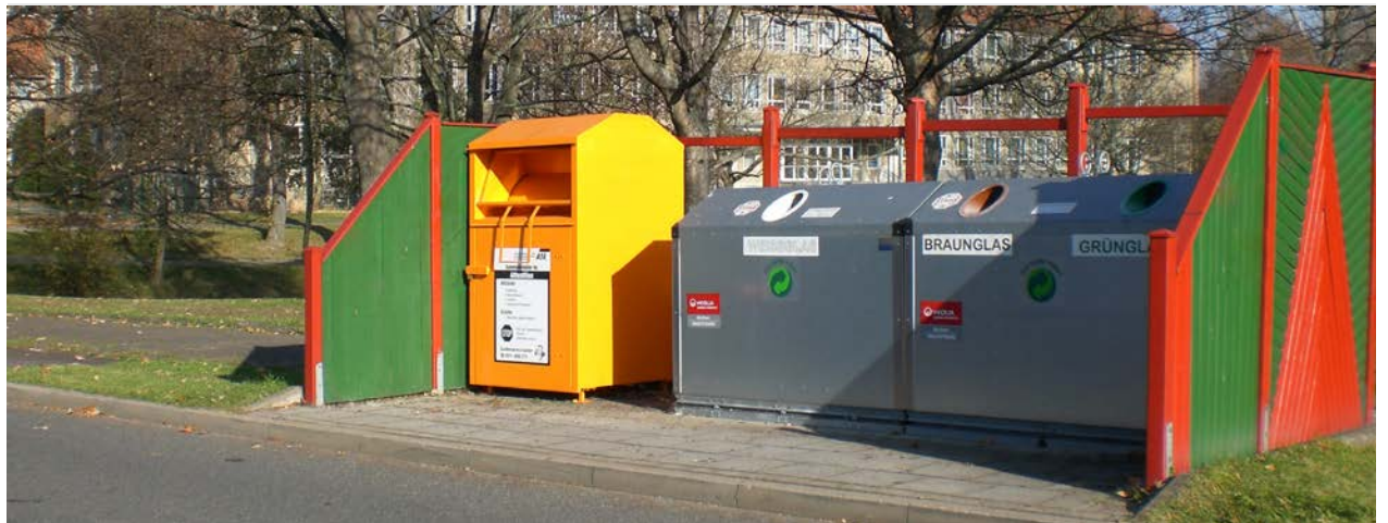
An vielen Wertstoffinseln bietet der ASR weiterhin orangefarbene Alttextilcontainer.