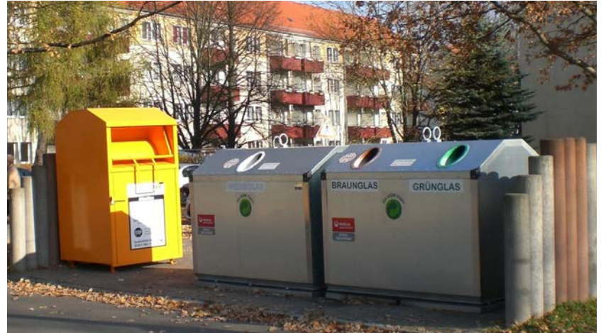
Die Depotcontainerstandplätze im ganzen Stadtgebiet tragen zur Ressourcenschonung und zum Umweltschutz bei.