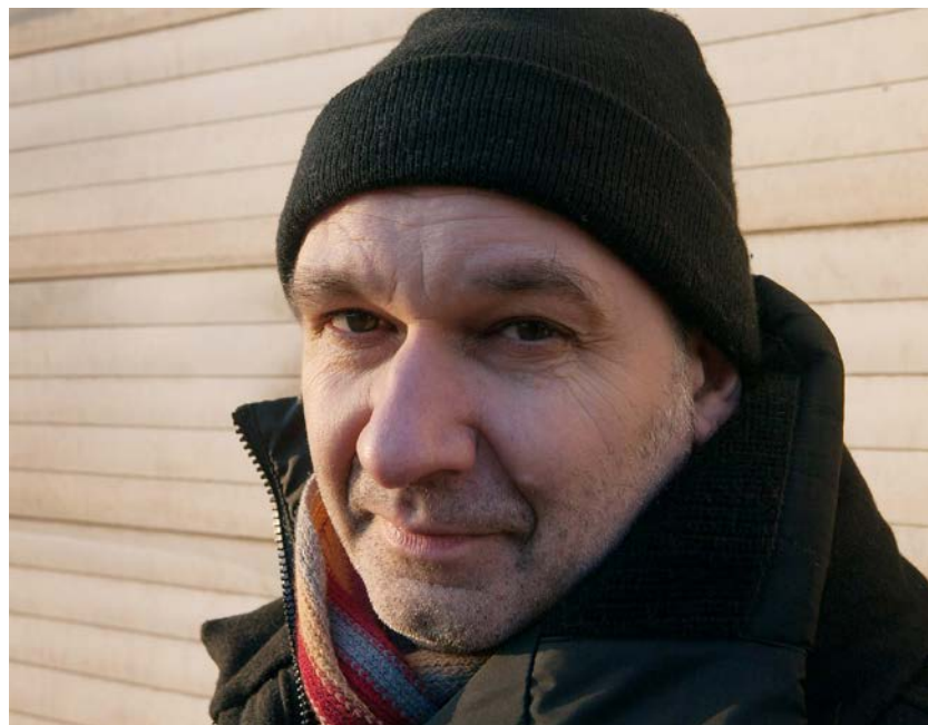
Burkhard Peter ist Fotograf.