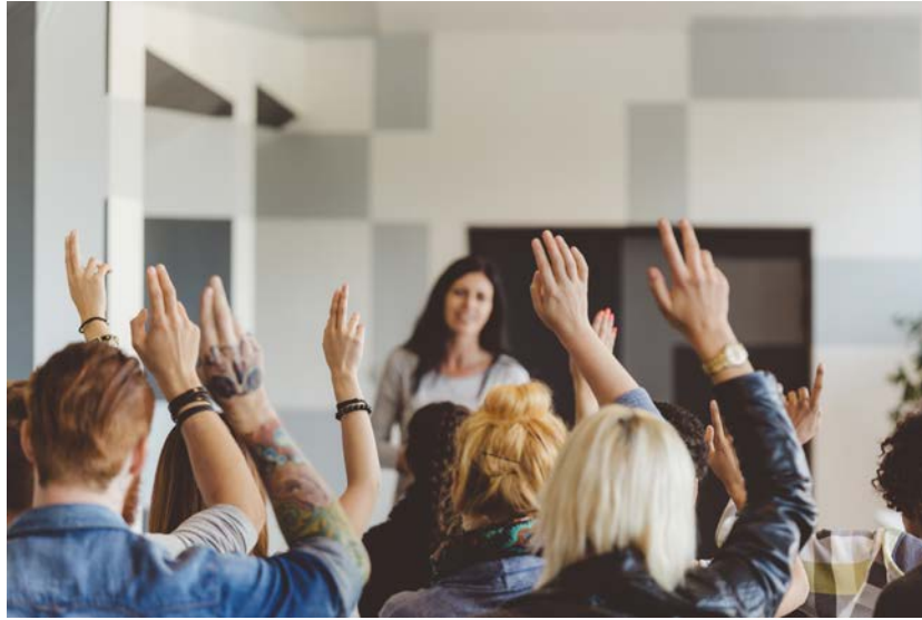
Auch im Sommersemester bietet die Volkshochschule Chemnitz natürlich neue und bewährte Kurse an.

Während des gesamten Sommersemesters gibt es für Interessierte reichlich zu entdecken. Dafür hat die Volkshochschule ein Programm mit knapp 600 Angeboten aus sechs verschiedenen Fachbereichen erarbeitet. Weitere Veranstaltungen werden in den nächsten Wochen noch hinzukommen. Unter