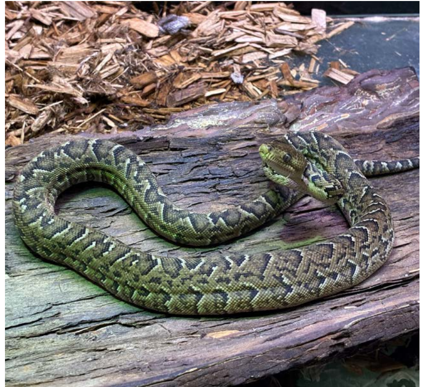
Die Kuba-Schlankboas gelten als hervorragende Jäger. Sie gehört zu den wenigen Schlangenarten, die gemeinschaftlich jagen.

Die Elterntiere hingegen können im Tropenhaus des Tierparks bewundert werden und geben den Besucherinnen und Besuchern einen Einblick in die Welt dieser Schlangenart. Der Tierpark beteiligt sich an dem Erhaltungszuchtprogramm für diese Art und leistet mit dem aktuellen Nachwuchs einen wichtigen Beitrag zur Erhaltung und zum besseren Verständnis der Kuba-Schlankboa.