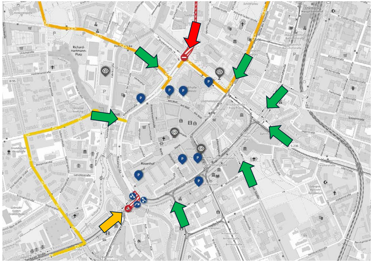
Das Linksabbiegen von der Zwickauer in die Theaterstraße ist aktuell nicht möglich.

Die Innenstadt ist weiterhin aus südöstlicher Richtung über die großen Einfallstraßen Annaberger Straße, Zschopauer Straße und Augustusburger Straße zu erreichen. Aus nordöstlicher Richtung bestehen Zufahrtsmöglichkeiten über die Bahnhofstraße und die Straße der Nationen. Aus westlicher Richtung können Autofahrerinnen und -fahrer das Stadtzentrum über die Hartmannstraße und die Kaßbergauffahrt anfahren. Die Mühlenstraße ist im Bereich vom Stadtbad bis zur Brückenstraße weiterhin voll gesperrt. Die kleinräumige Umleitung über Georgstraße, Straße der Nationen und Brückenstraße bleibt eingerichtet. Eine großräumige Umleitung ist über die Hartmannstraße, die Bergstraße, die