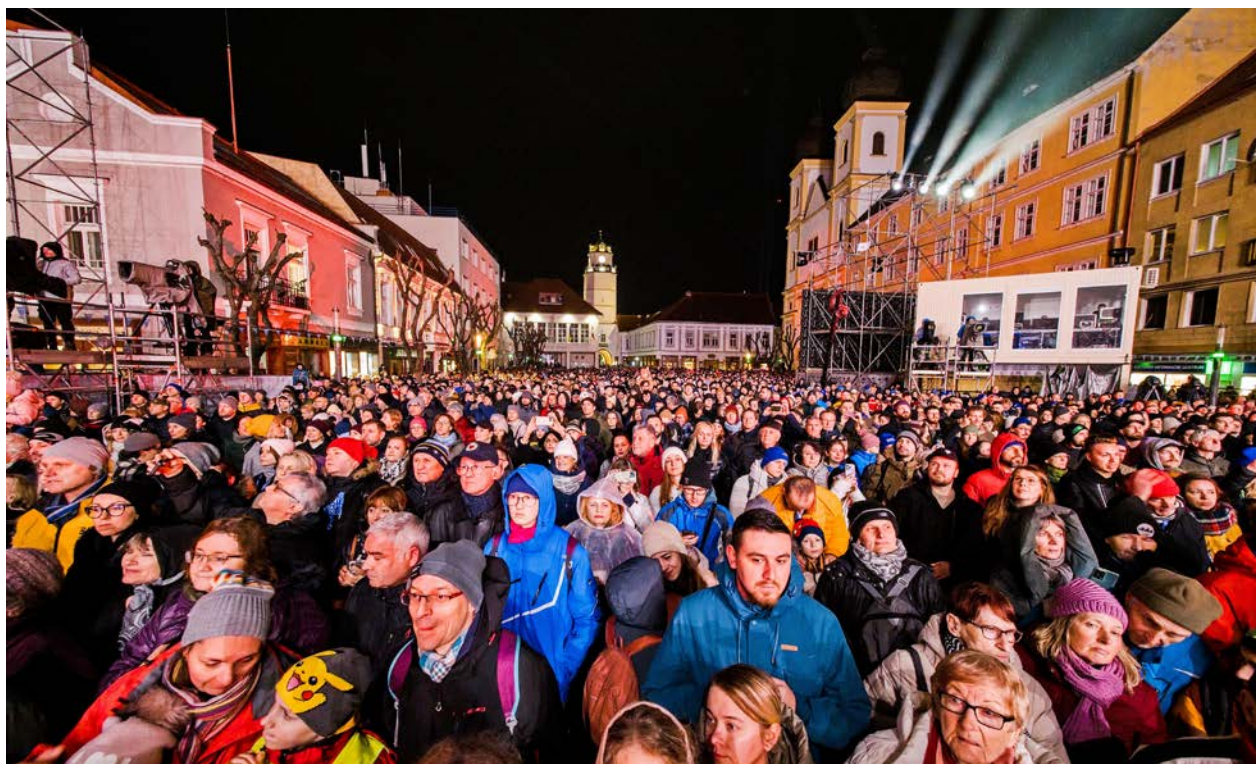
Das vielfältige Programm am Eröffnungswochenende des Kulturhauptstadtjahres zog viele Menschen an.