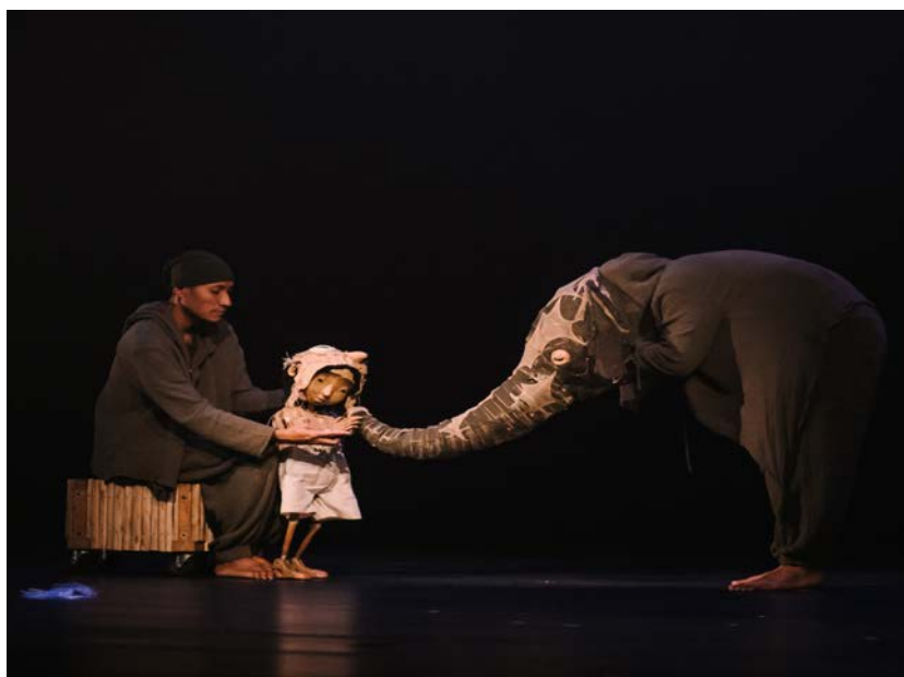
Links: Im Figurentheater »Stream of Memory« sagen Bilder und Bewegungen mehr als tausend Worte. | Rechts: Der Riese Kali beugt sich auf eine Reise, um herauszufinden, wer er wirklich ist und wer er einst war.

Trägerschaft aus. Ende der 1970er Jahre vom deutschen Zentrum des Internationalen Theaterinstituts e. V. (ITI) initiiert, ist das Festival Theater der Welt seitdem alle drei Jahre in einer anderen deutschen Stadt zu erleben. Es ist ein Schaufenster für aktuelle ästhetische Entwicklungen in den darstellenden Künsten weltweit. Nach Hamburg 2017, Düsseldorf 2021 und Offenbach-Frankfurt 2023 kommt Theater der Welt nun, seit der Ausgabe 1996 in Dresden, nach genau 30 Jahren zurück nach Sachsen. www.theaterderwelt.de