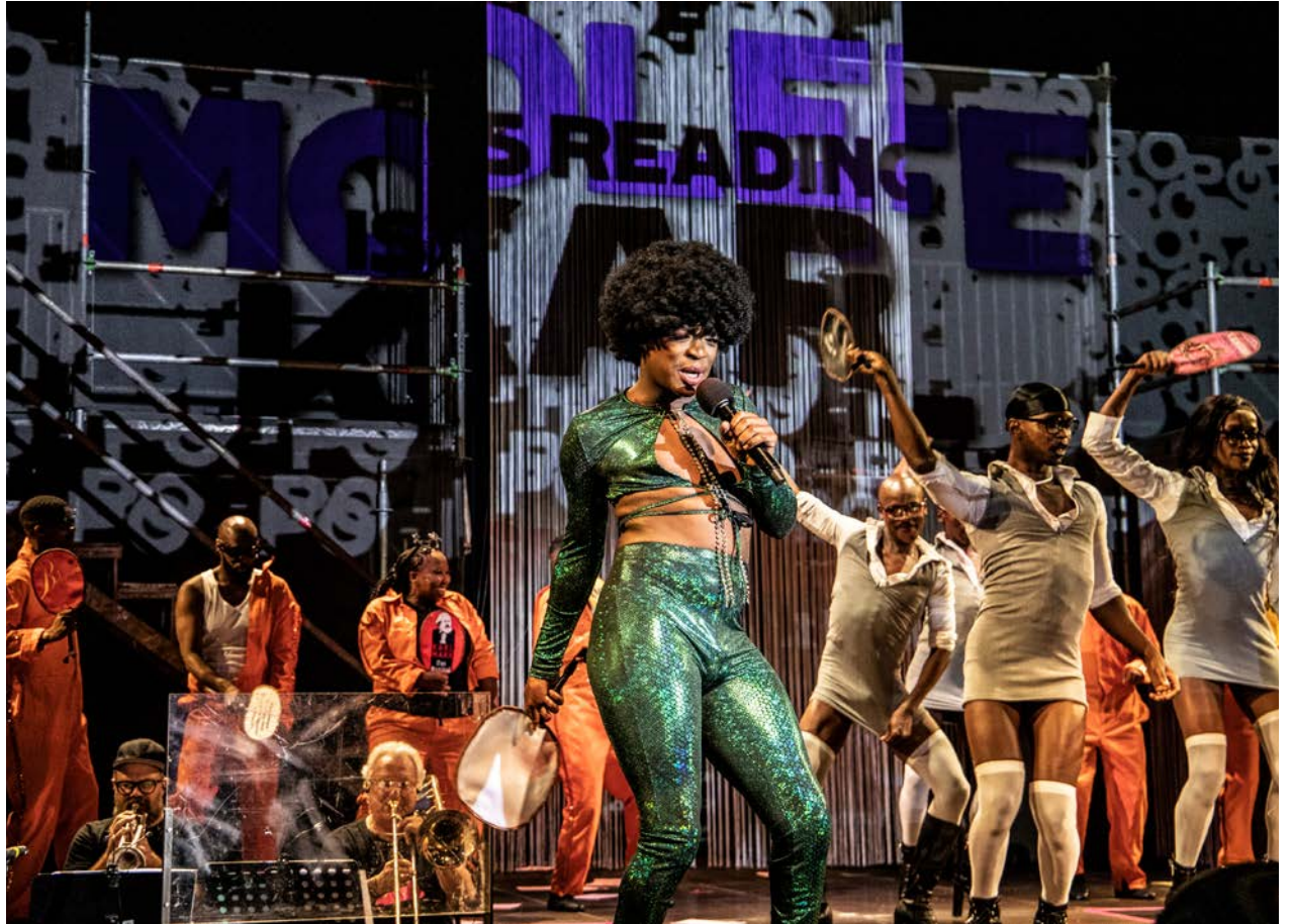
Das Publikum kann sich bei der »Nkoli The Vogue Opera« auf einen stimmungsvollen und bunten Abend freuen.

Im Opernhaus Chemnitz wird am 27. und 28. Juni das Theaterstück »Amadoka«