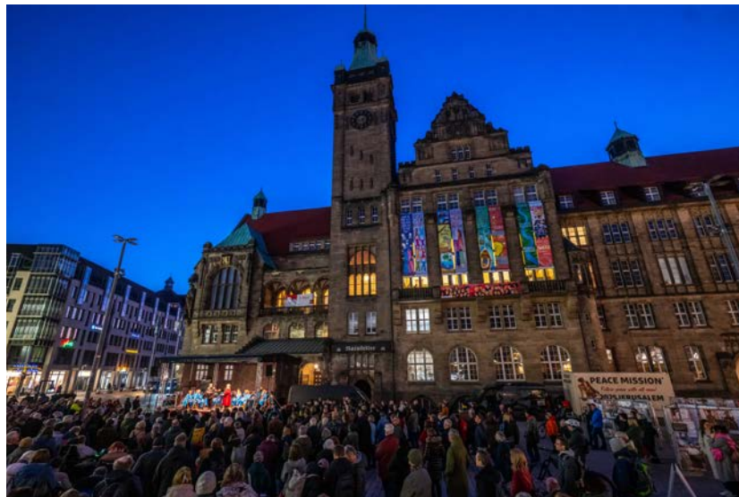
Wie im vergangenen Jahr findet die Abschlussfeier des Friedenstages um 18 Uhr auf dem Neumarkt statt.