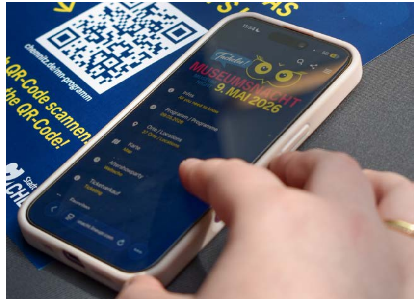
Mit der Event-App zum Programm der Museumsnacht

An verschiedenen Orten erleben Kulturinteressierte die Museen in einem anderen Licht. So zeigt die am Tag zuvor eröffnende Ausstellung »Threads – Verflechtungen« im smac – Staatliches Museum für Archäologie Chemnitz – die Netzwerke von 25 jüdischen Familien,