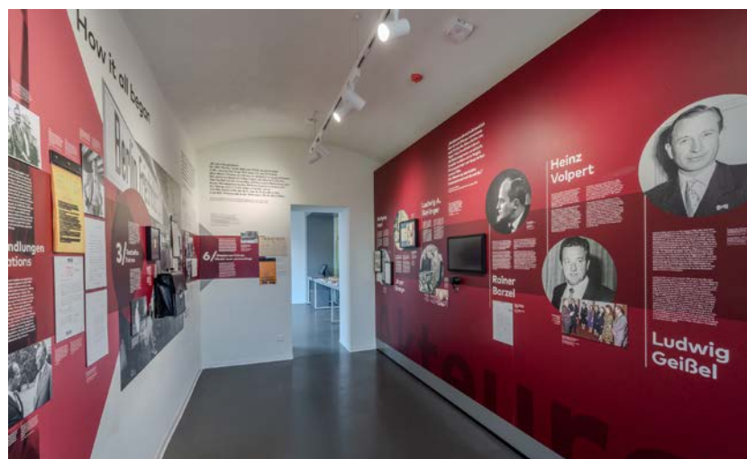
Bei der Museumsnacht gibt es im ehemaligen Kaßberg-Gefängnis Gespräche mit Zeitzeuginnen und Zeitzeugen.

Die Tickets können vorab online unter www.chemnitz.de/tickets_museumsnacht sowie an allen Vorverkaufsstellen erworben werden. Das Museumsnacht-Ticket ist zum Preis von 12 Euro (ermäßigt 6 Euro) sowie als Familienkarte für 24 Euro erhältlich. Kinder bis zur Einschulung erhalten freien Eintritt. ■ Weitere Informationen zum Programm sind unter www.chemnitz.de/museumsnacht und in der App zu finden.