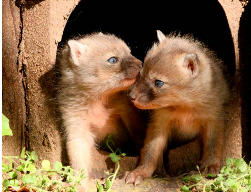
Die Steppenfuchs-Welpen gehen in ihrem Gehege auf Entdeckungstour.