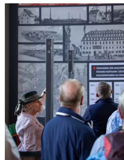
Viel Wissenswertes konnten die Teilnehmenden bei einer Führung in der Hartmannfabrik erfahren.