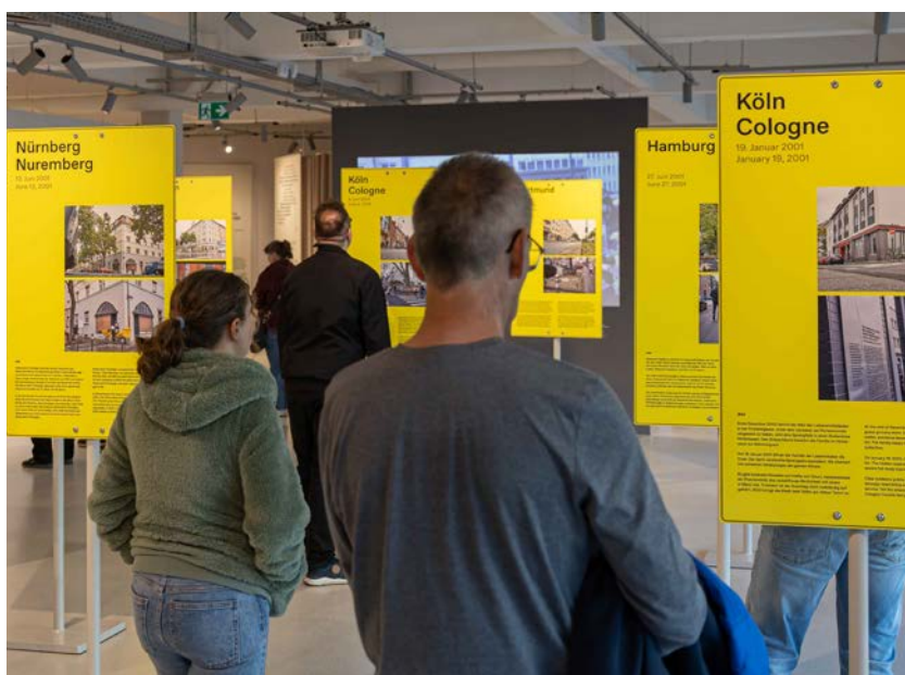
In diesem Jahr war das Dokumentationszentrum zum NSU-Komplex zum ersten Mal bei der Chemnitzer Museumsnacht dabei.