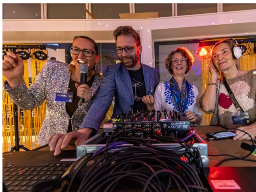
Partystimmung im smac: Mitarbeitende des Museums sorgten am DJ-Pult für musikalische Unterhaltung und gute Laune.