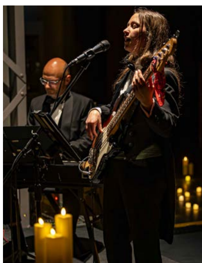
Musik im Schein hunderter Kerzen sorgte für eine stimmungsvolle Atmosphäre im Industriemuseum.

Die Museumsnacht 2026 in Chemnitz ist wieder ein Erfolg gewesen. Die 37 Museen, Einrichtungen und Galerien zählten zusammengerechnet 23.750 Gäste.