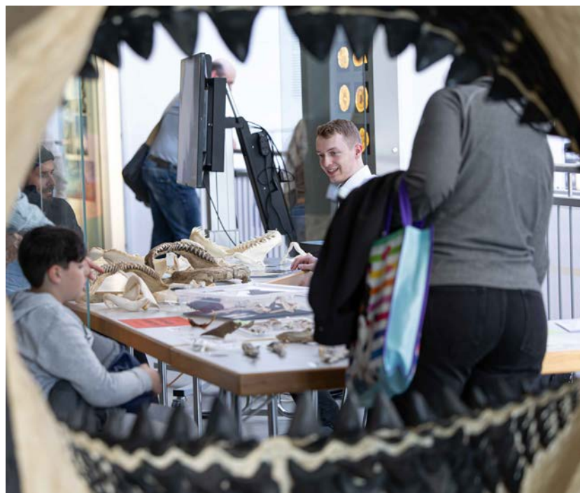
Links: Besucherinnen und Besucher konnten Interessantes und Wissenswertes bei der Führung durch die Ausstellung »Mahlzeit« im Museum Gunzenhauser erfahren. | Rechts: Besonders für Kinder bot das Museum für Naturkunde Chemnitz an diesem Abend ein vielfältiges Mitmach- und Entdeckungsangebot.