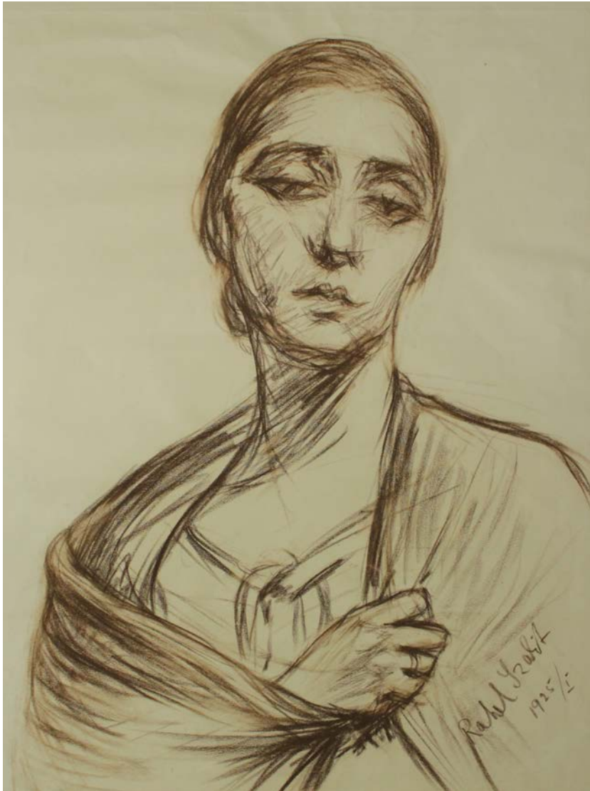
In der Ausstellung »Eine unvollendete Geschichte« werden unter anderem Werke der Künstlerin Rahel Szalit (1894–1942) gezeigt: Selbstbildnis, 1925. Pastell auf Papier. Kunstsammlungen Chemnitz.