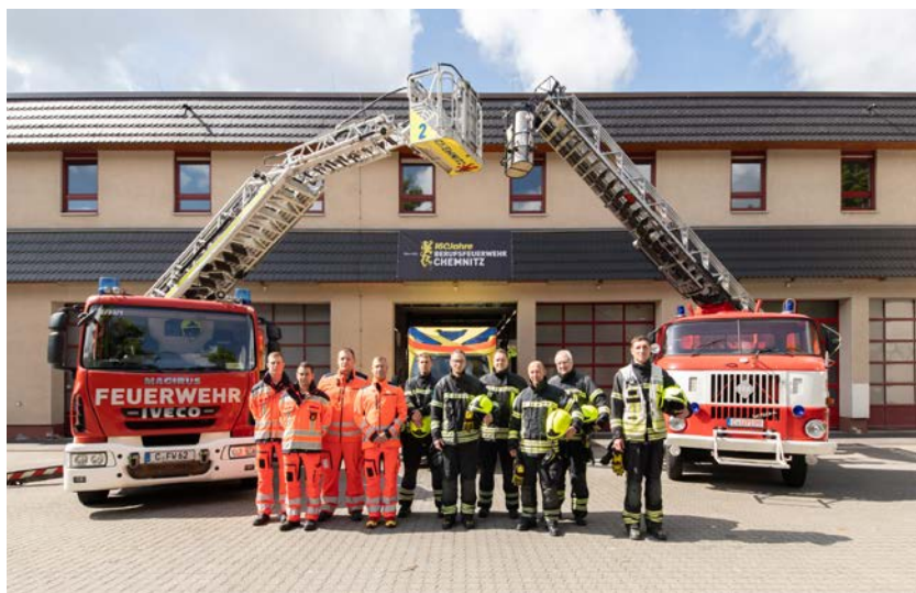
Links: Am Samstag warten beim Tag der offenen Tür in der Feuerwache 2 zum Beispiel historische Fahrzeuge und ein realistischer Eignungstest auf die Gäste. | Rechts: Vorderansicht der Feuerwache 2 im Jahr 1924.