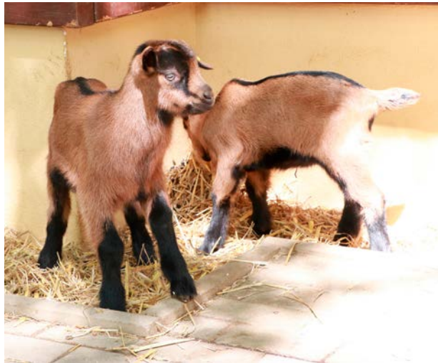
Links: Im Streichelgehege können Gäste fünf kleine Erzgebirgsziegen beim Herumtollen miterleben. | Rechts: Auch bei den Westkaukasischen Steinböcken freut man sich über Nachwuchs.