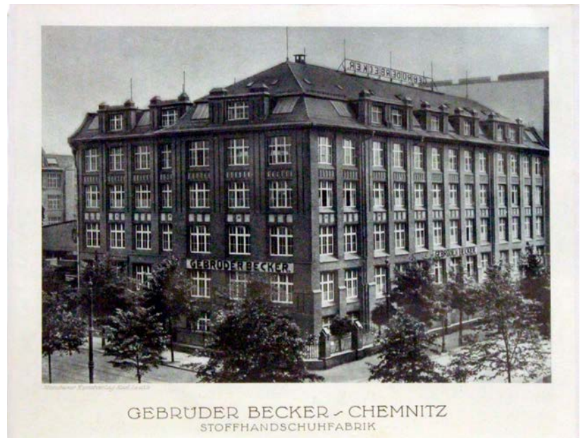
Das Foto zeigt das Firmengebäude der Gebrüder Becker. Es ist Teil der Ausstellung »Erfolgsspuren. Jüdische Unternehmer in Chemnitz«.

Die Ausstellung wird begleitet von mehreren Mitmachstationen für junge Gäste sowie thematischen Spaziergängen, die abwechselnd über den Kaßberg und den Kapellenberg führen und reale Spuren jüdischer Unternehmer sichtbar machen. Der erste Spaziergang findet am 7. Juni von 10 bis 12 Uhr statt. Weitere Informationen und die Anmeldung zur Führung sind zu finden unter www.industriemuseum-chemnitz.de . ■