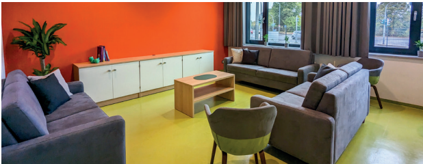
Aufenthaltsraum für Bewohner