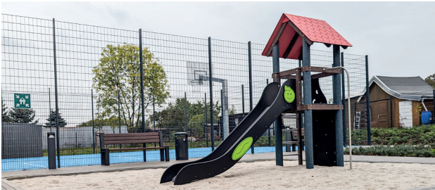
Sicherer Kinderspiel- und Basketballplatz