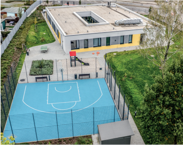
Gelände- und Gebäudeansicht unserer Einrichtung