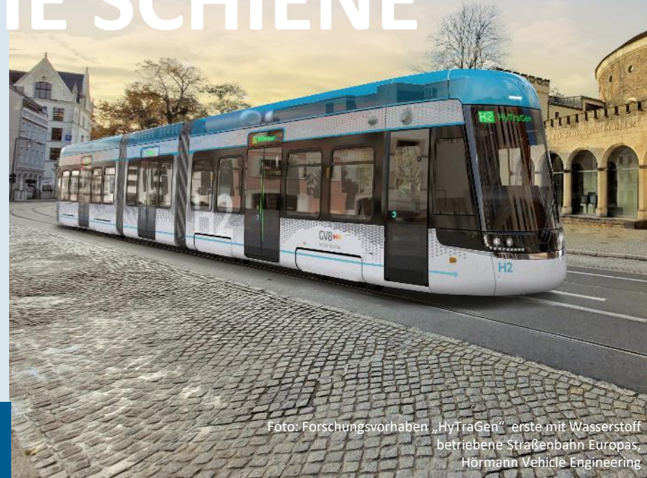
Foto: Forschungsvorhaben „HyTraGen“ – erste mit Wasserstoff betriebene Straßenbahn Europas, Hörmann Vehicle Engineering

Historie der Mobilität: Chemnitz ist Wiege des Lokomotivbaus mit Richard Hartmann. Auto Union startete als erster Automobilkonzern Deutschlands seine Produktion in Chemnitz.