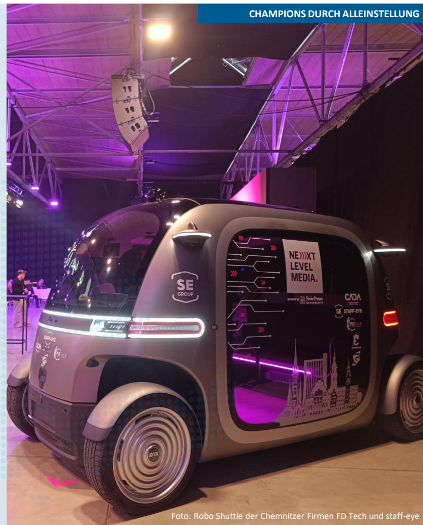
Foto: Robo Shuttle der Chemnitzer Firmen FD Tech und staff-eye